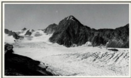
LE GLACIER DU GÉBOULAZ EN 1949.