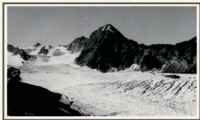
LE GLACIER DU GÉBROULAZ EN 1949.