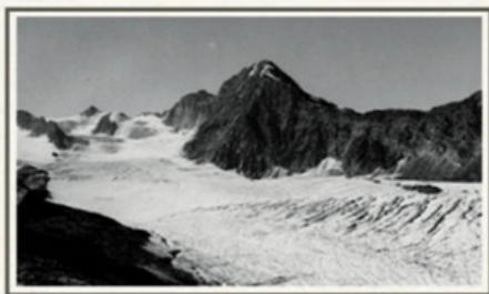
LE GLACIER DU GÉROULAZ EN 1949.