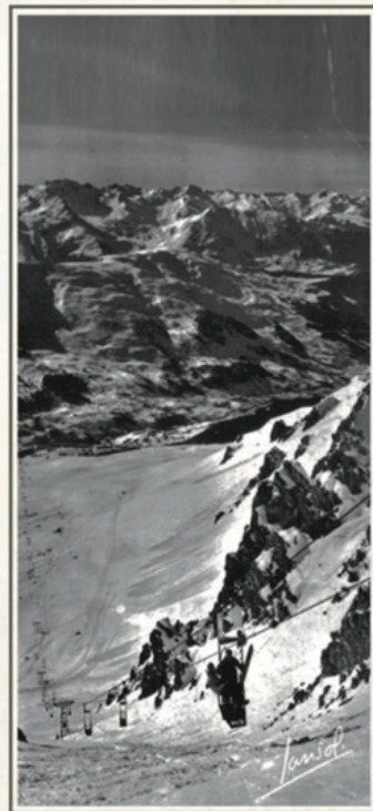
TÉLÉPHÉRIQUE - 1941